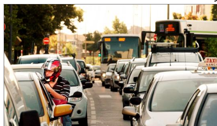
Les élus communautaires ont adopté la création d'un service visant à limiter l'impact environnemental de la voiture dans la ville.

Bouxières-aux-Dames L'écologie et le vélo pour des solutions innovantes