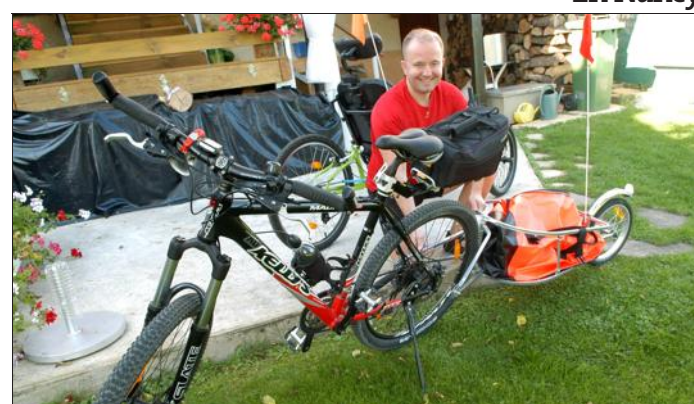
Des vélos qu'on ne trouve pas facilement, qui marient les dernières technologies et les nouvelles tendances du déplacement doux.

Diarville Fourgonnette contre un arbre : un mort