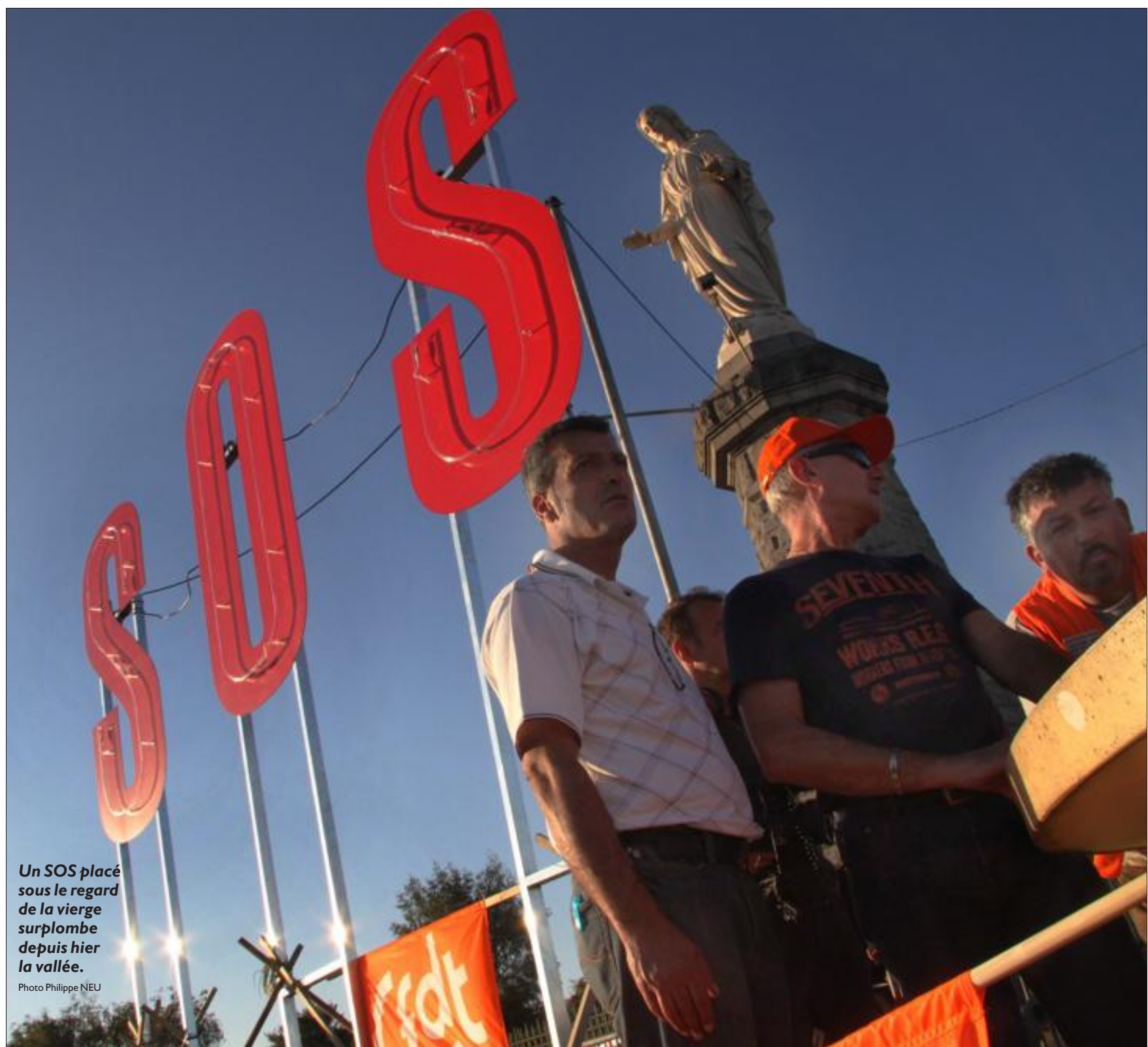
Un SOS placé sous le regard de la vierge surplombe depuis hier la vallée.

Tous ceux qui refusent que soient portés de nouveaux coups à la sidérurgie lorraine vont converger aujourd'hui vers Hayange pour une opération « Vallée morte ». Elus, travailleurs, commerçants et population de toute la Fensch ont décidé de se battre et veulent que leur SOS soit entendu.