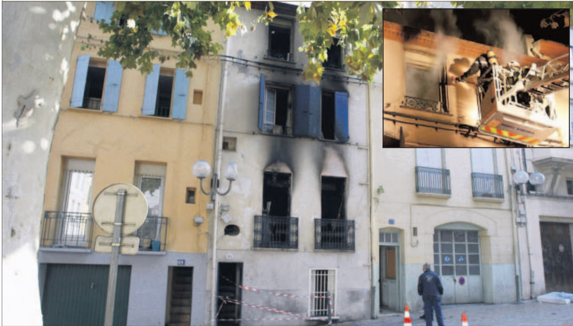
L'incendie s'est déclaré au premier étage de cet immeuble situé place du Saré, en lisière du quartier Saint-Matthieu.

■ Dans cet incendie, trois membres d'une même famille ont été grièvement blessés.