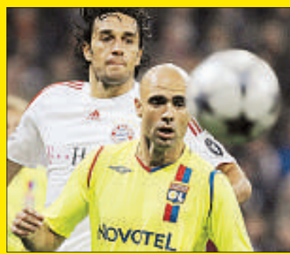
1-1 : objectif minimum atteint pour l'OL.

< FOOTBALL Lyon obtient un nul au Bayern PAGE 22